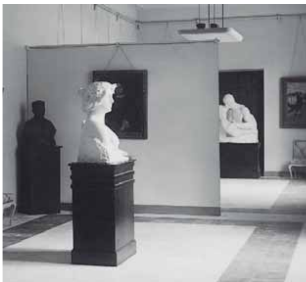
Exposició d'art instal·lada a la Casa de la Vila en 1941.

En aquells dies aparegueren en la premsa local articles d'opinió que reivindicaven convertir l'antiga Casa de la Vila de la placeta del Carbó en un Museu d'Arqueologia i Belles Arts, i Biblioteca Pública. 4 La proposta no va prosperar fins després d'acabada la Guerra Civil, quan l'Ajuntament va prendre l'acord de rehabilitar la Casa de la Vila i les obres es portaren a terme entre 1939 i 1940. 5 L'edició del programa de les Festes de 1941 reproduïx dues fotos de l'interior del Museu (quan encara no s'havia inaugurat oficialment), amb una exposició d'escultures i pintures d'artistes locals.