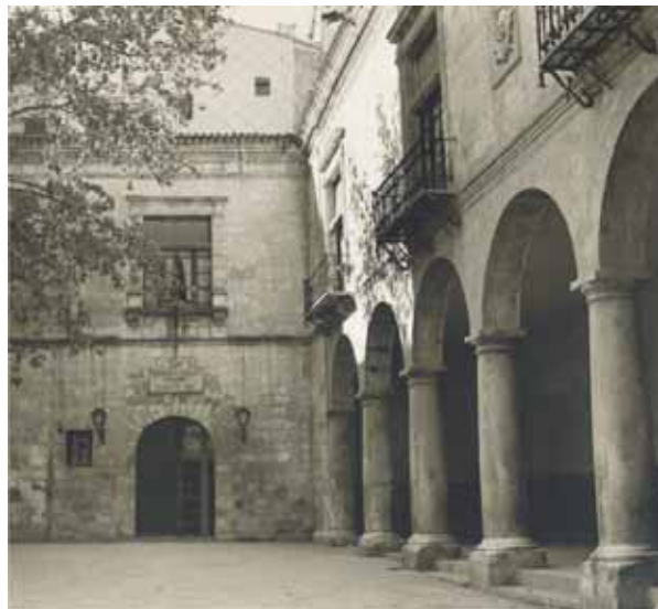
Antiga Casa de la Vila adaptada en 1945 per a biblioteca i museu.

És probable que algun llenç de Llorenç Pericàs Ferrer ( Retrat de senyora , Retrat de xiqueta i Jove en actitud mística ) o el Xinés amb fanal , de Roger Solroja Jordà, i també el paisatge de Juli Pascual Espinós titulat Capvespre , formaren part de la col·lecció des d'un primer moment, fruit de les donacions dels seus autors.