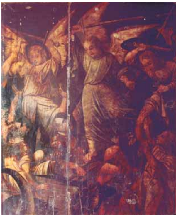
Autor anònim, L'Arcàngel Sant Gabriel .

d'aquest fons artístic. La manca d'aquest espai possiblement va ser un dels motius pels quals no va prosperar la petició amb què l'Ajuntament, en 2009, demanava a la Conselleria de Cultura el reconeixement d'aquest fons artístic com a Col·lecció Museogràfica Permanent.