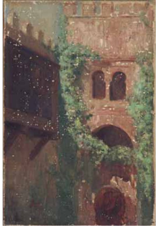
Pati de l'estudi de Cabrera

Inicis s. XX; oli sobre tela, 20 x 15 cm; cat. P-300. Atribuït