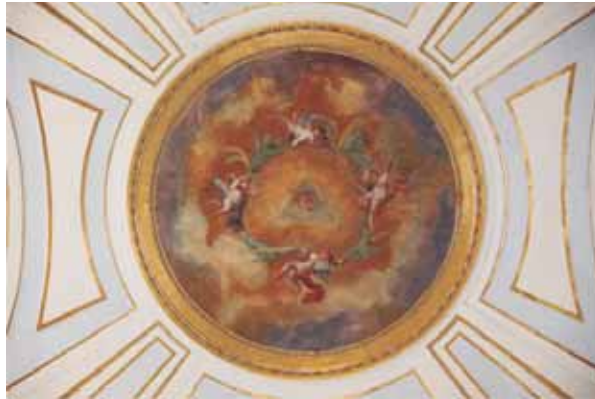
Déu Pare envoltat per una glòria d'àngels