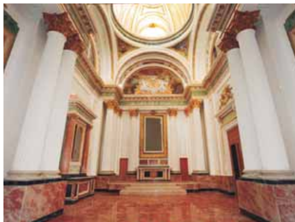
Capella de la Mare de Déu dels Desemparats.