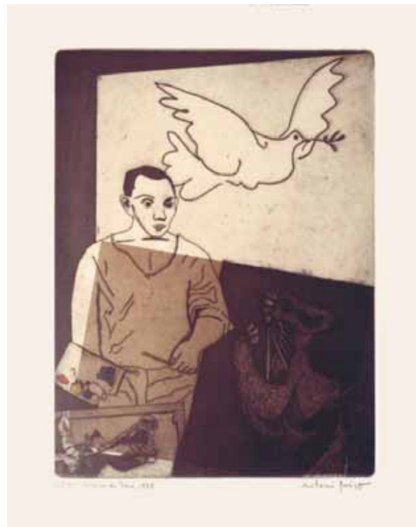
A. Miró, Colom de Pau .

El periòdic Ciudad de Alcoi en 2010 va tenir la iniciativa de demanar a dotze artistes alcoians que pintaren la seua visió sobre la Cavalcada dels Reis. Les dotze obres van ser reproduïdes mitjançant una edició de làmines anomenada Dotze mirades màgiques , les quals es distribuïren gratuïtament amb el diari. Els originals de les referides dotze pintures foren lliurades a l’Ajuntament d’Alcoi per part de l’esmentat periòdic Ciudad de Alcoi.