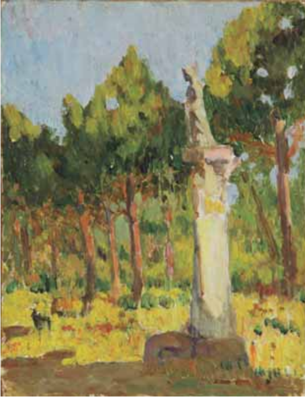
Monument de la Menora

Inicis s. XX; oli sobre tela, 20 x 15 cm; cat. P-300. Atribuït