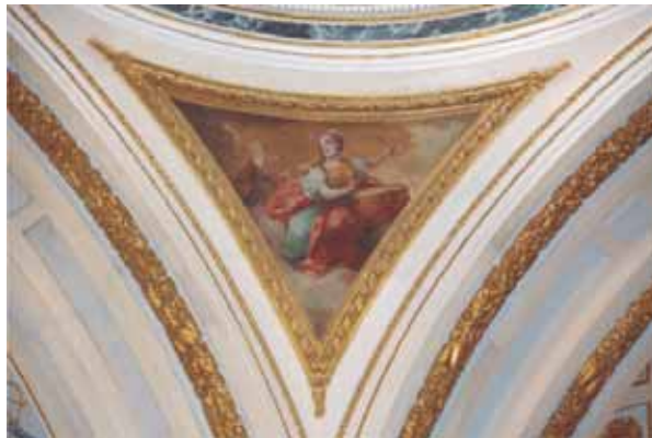
La profeta Maria