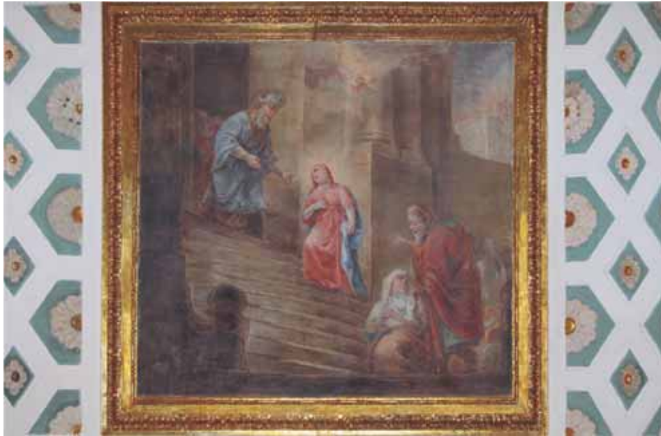
La Presentació de la Verge en el temple