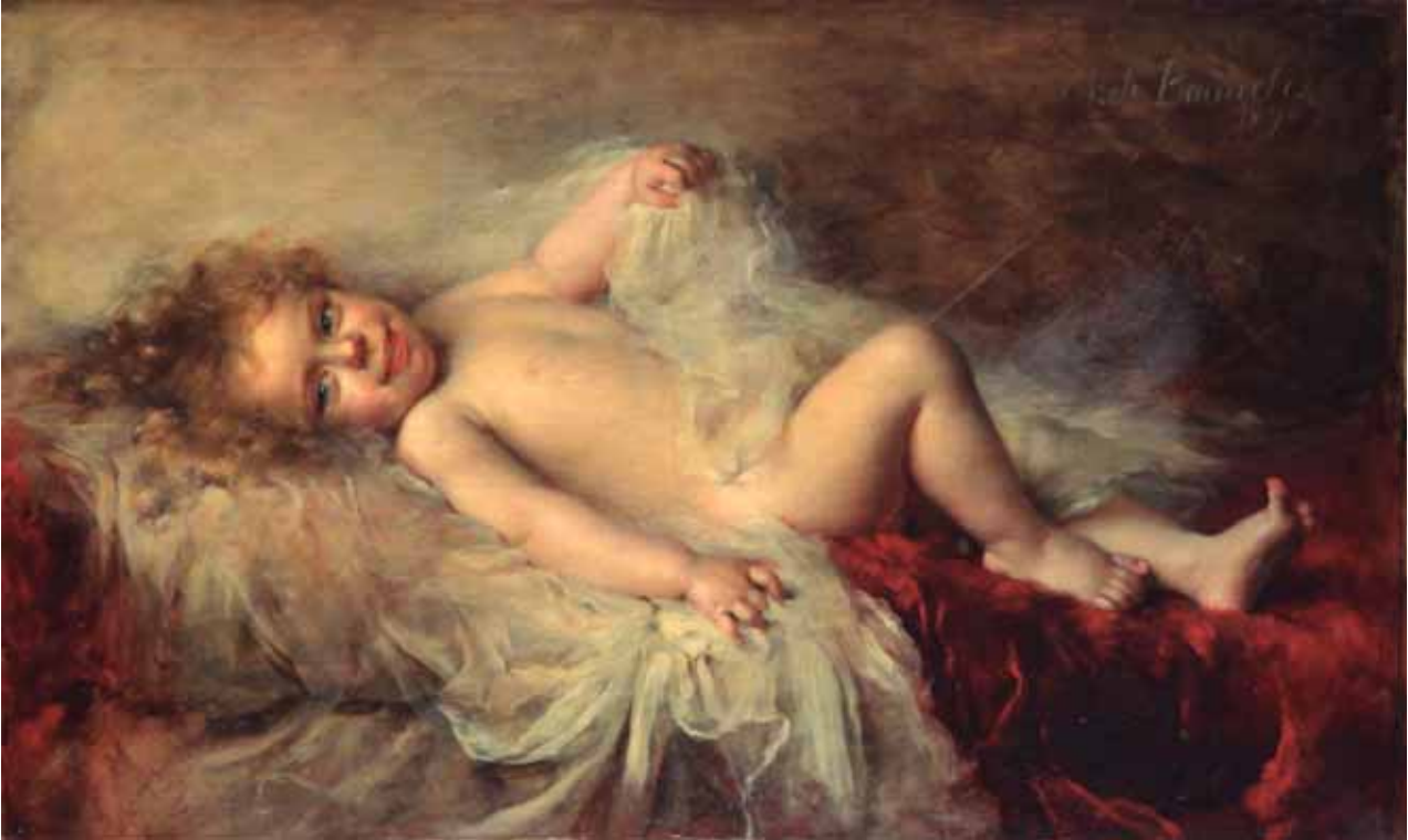
El despertar d'un infant 1890; oli sobre tela, 61 x 101 cm; cat. P-9