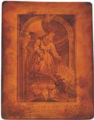
Planxa de gravat, El Niño Jesús del Milagro .

El 1998, la “II Biennial d’Art d’Alcoi” va duplicar la seua dotació gràcies a l’aportació d’un milió de pessetes afegida per part de l’empresa Mirofret, S. A., i van arribar fins a 404 les obres presentades, procedents de trenta països. Les adquisicions d’obres en van ser vint-i-huit, que es van integrar al patrimoni de l’Ajuntament d’Alcoi. En aquestes dues convocatòries es van organitzar les corresponents exposicions de les obres seleccionades i es van publicar els catàlegs editats pel Centre Cultural d’Alcoi.