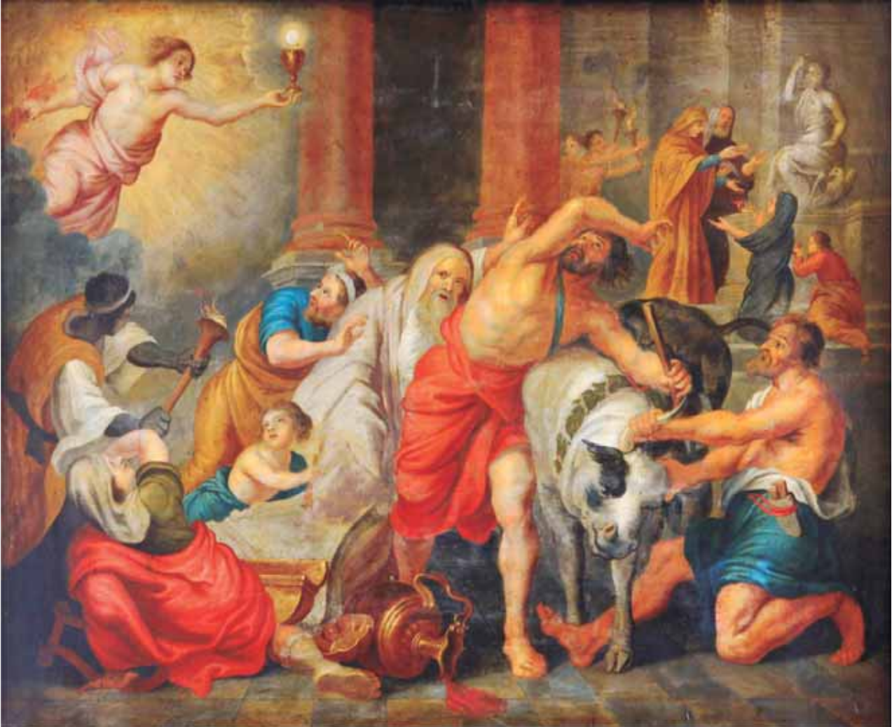
Triomf de l'Eucaristia sobre la idolatria Segle XIX; oli sobre làmina de coure, 70 x 84 cm; cat. P-7