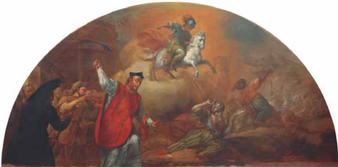
La batalla del poble alcoià contra les tropes del cabdill Alazarch

1852; oli sobre tela (lluneta), 174,7 x 350 cm Bibliografia: Hernández Guardiola, 2011, pp. 184-189 Exposicions: Alcoi, 2011, núm. 19 Obres restaurades per la Fundació de la C. V. La Llum de les Imatges