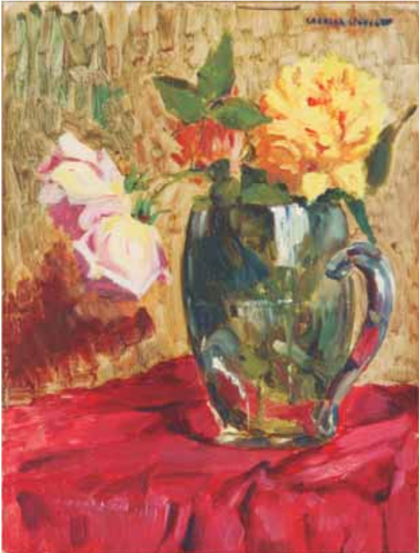
Pitxer amb roses

Anys 1920; oli sobre taula; 29,5 x 22 cm; cat. P-301